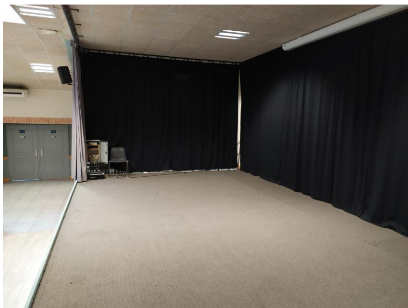
Vue Côté Jardin