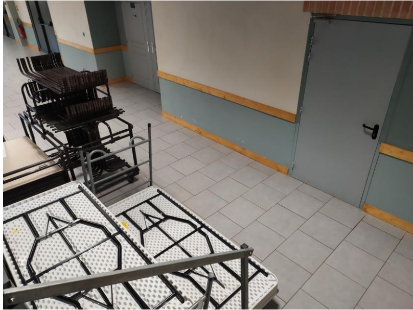
Espace loge à aménager