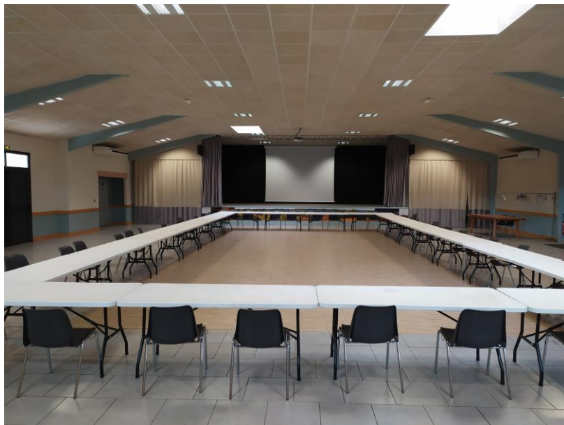
Vue de l'écran depuis le fond de salle