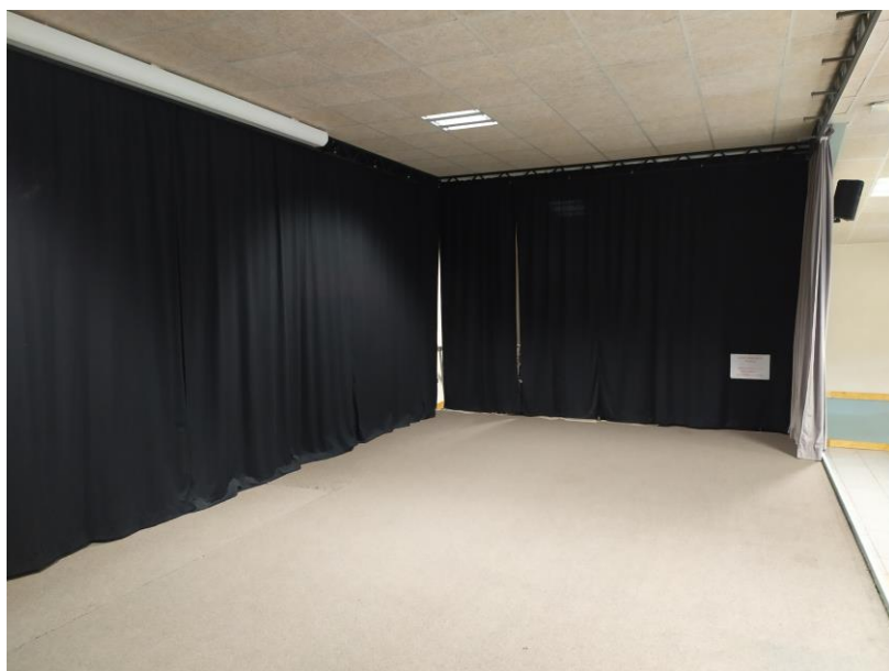
Vue Côté Cour