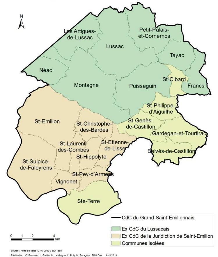
La genèse du Grand Saint Emilionnais