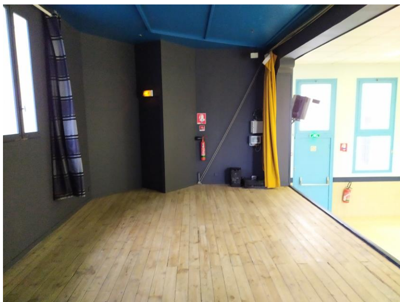
Vue Côté Cour